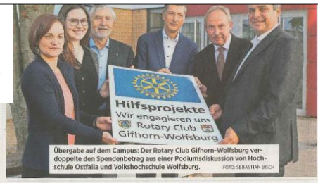
Übergabe auf dem Campus: Der Rotary Club Gifhorn-Wolfsburg verdoppelte den Spendenbetrag aus einer Podiumsdiskussion von Hochschule Ostfalia und Volkshochschule Wolfsburg.

währt. In diesem Sessions-Thema „Erfolgreich Mittelpunkt“, erläuterte Ostfalia-Glücksforscher Hoffmeister von der