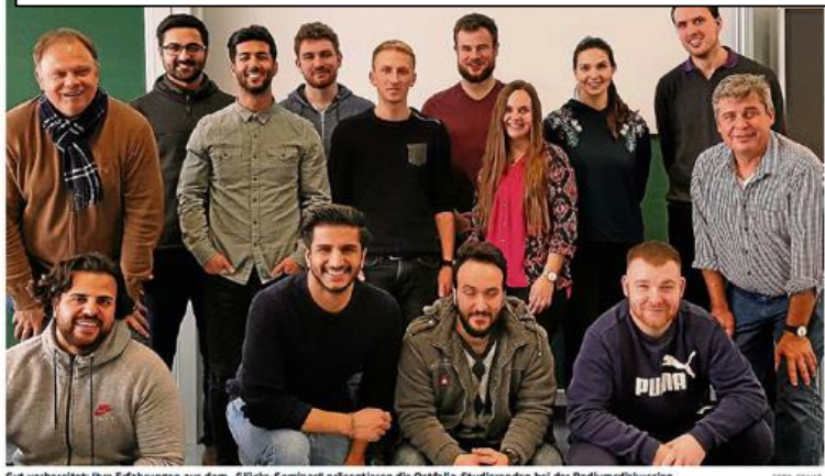
Gut vorbereitet: Ihre Erfahrungen aus dem „Glücks-Seminar“ präsentieren die Ostfalia-Studierenden bei der Podiumsdiskussion.